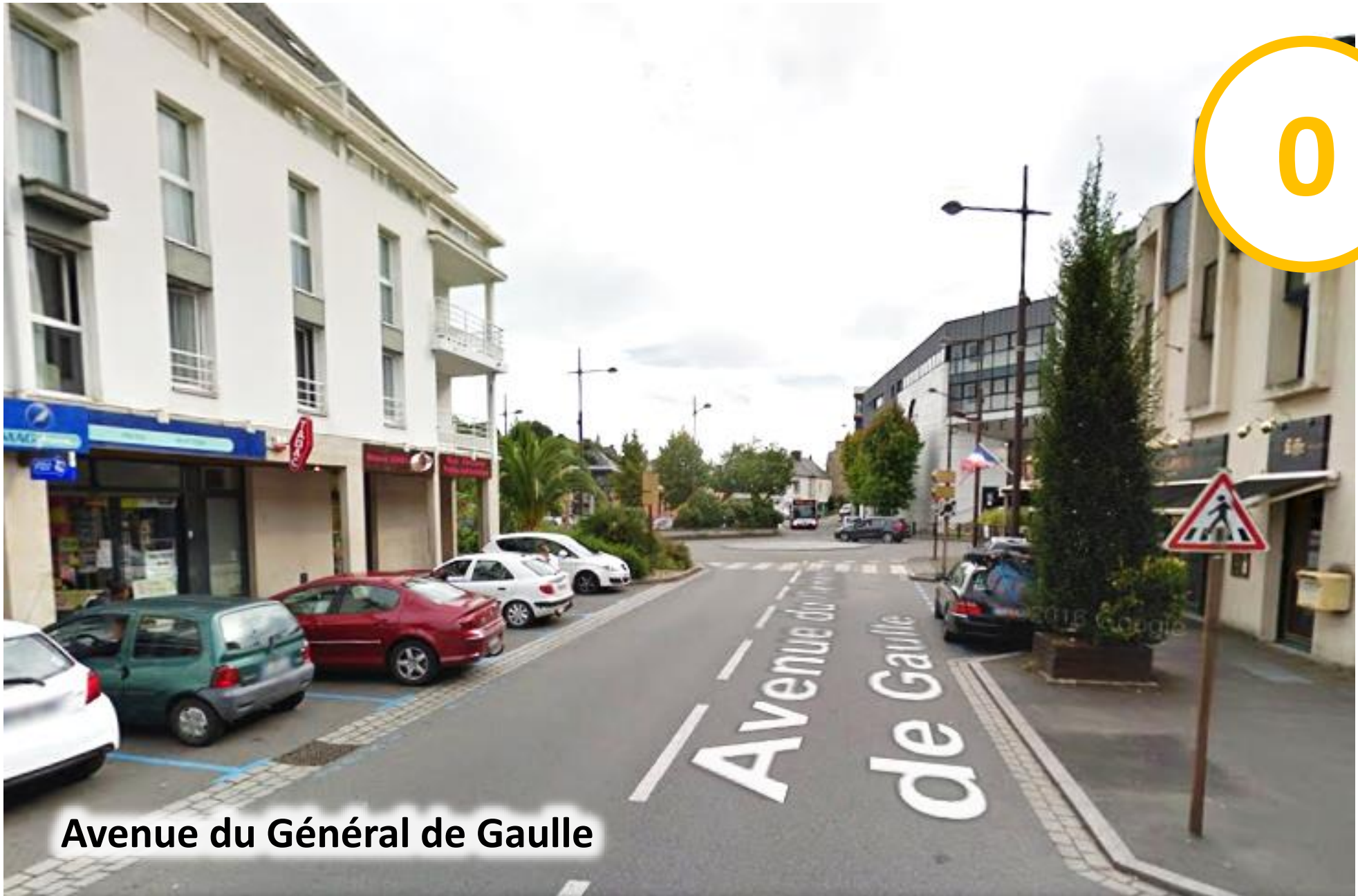
Avenue du Général de Gaulle