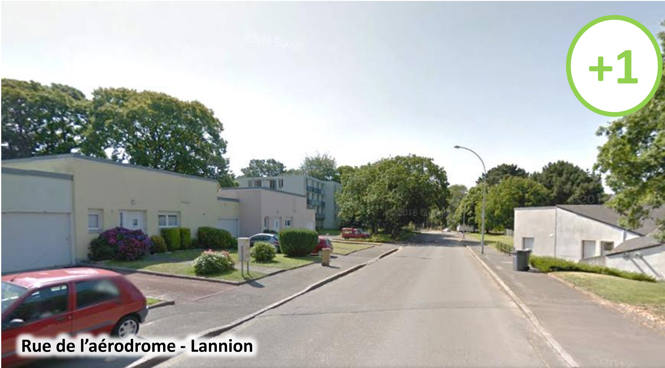
Rue de l'aérodrome - Lannion