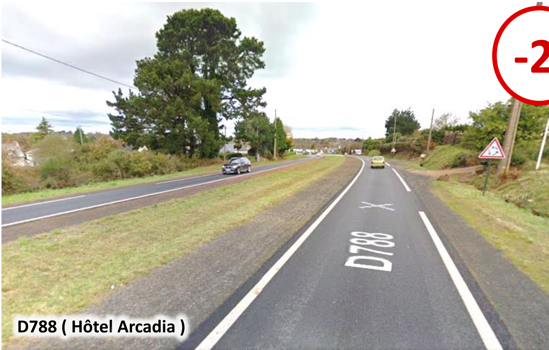
D788 ( Hôtel Arcadia )