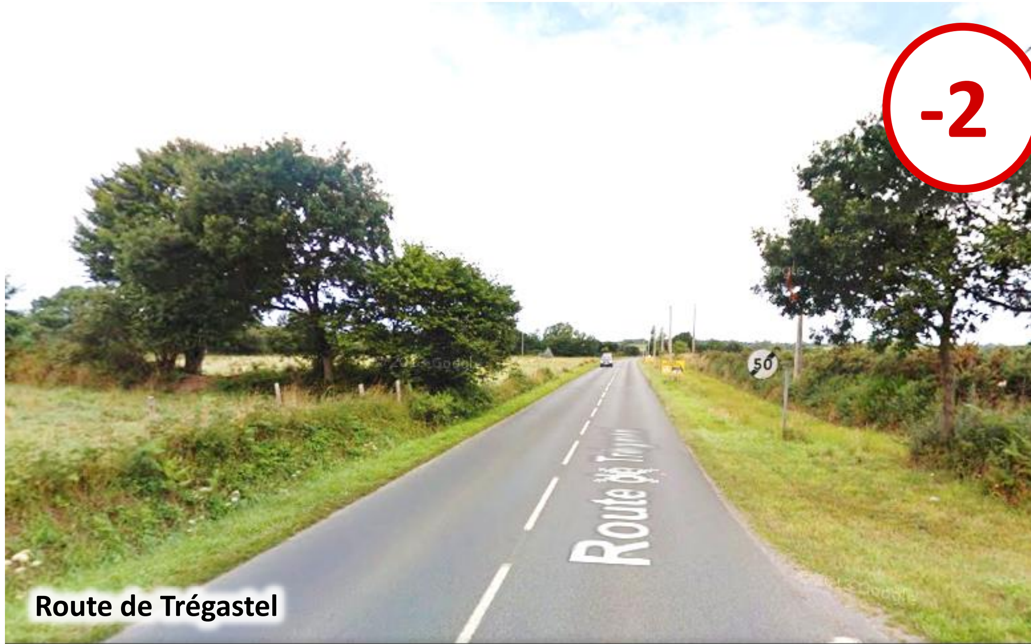
Route de Trégastel