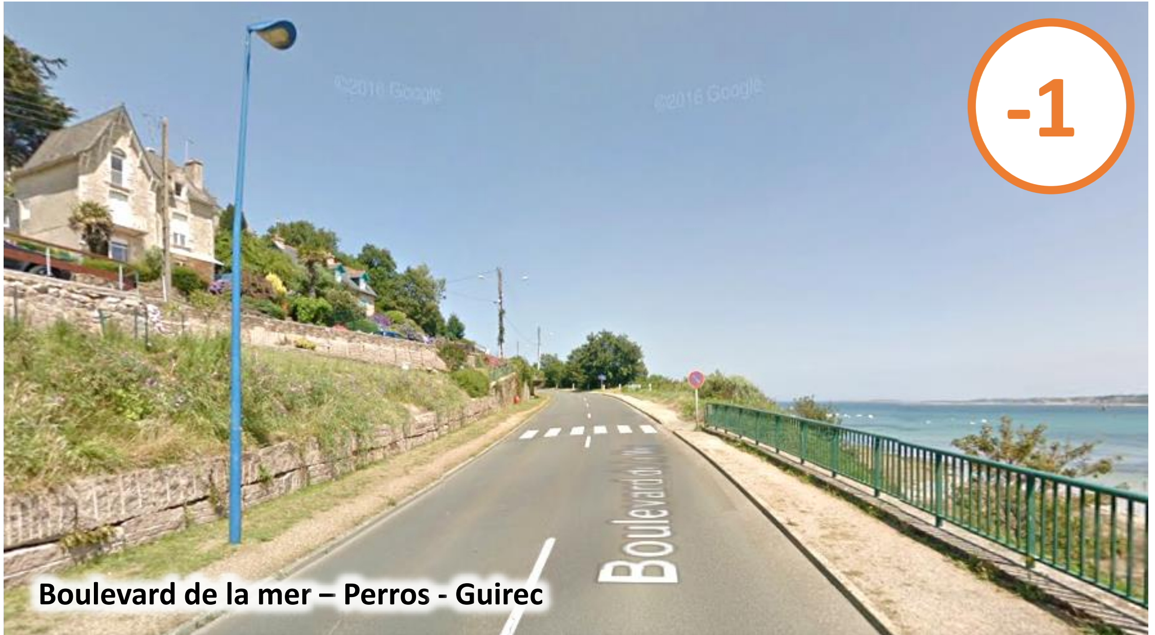
Boulevard de la mer – Perros - Guirec