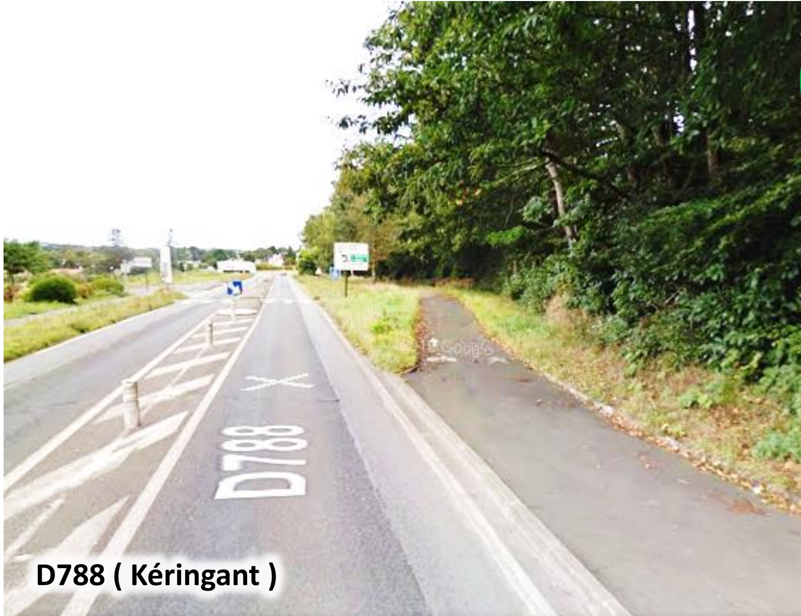
D788 ( Kéringant )