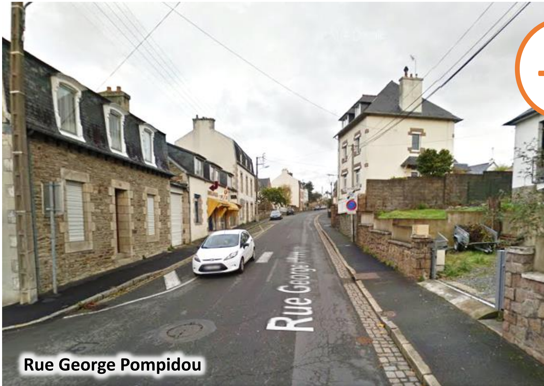
Rue George Pompidou