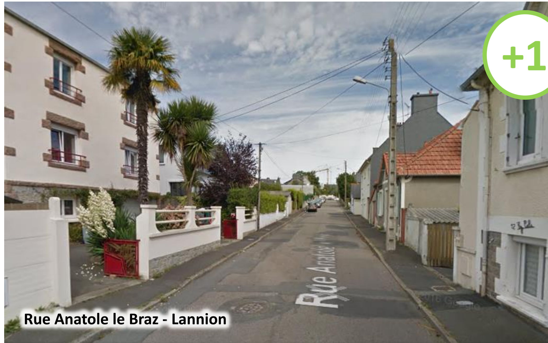
Rue Anatole le Braz - Lannion