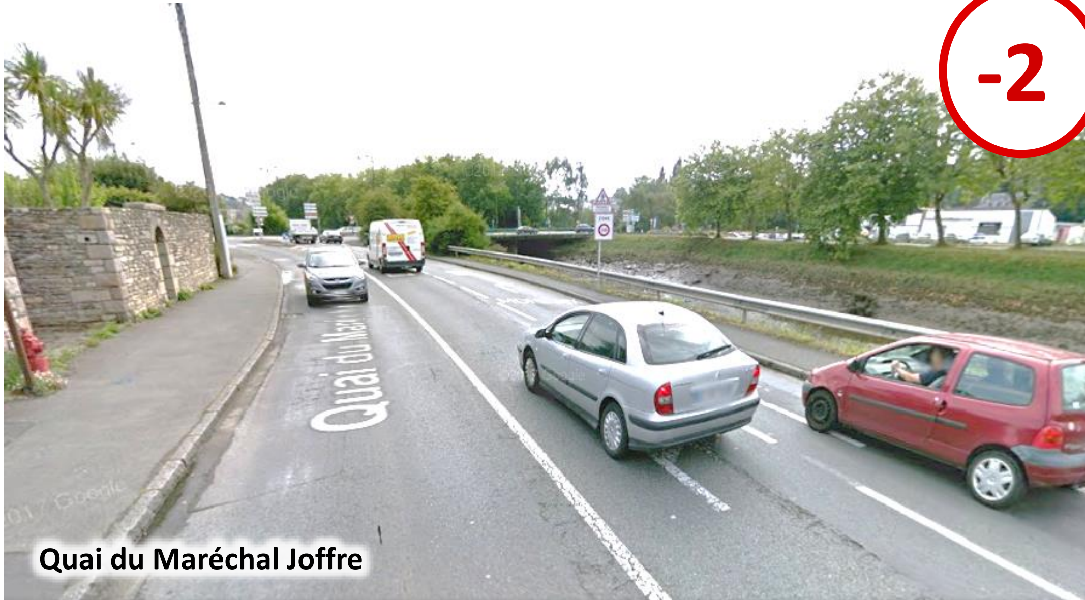
Quai du Maréchal Joffre