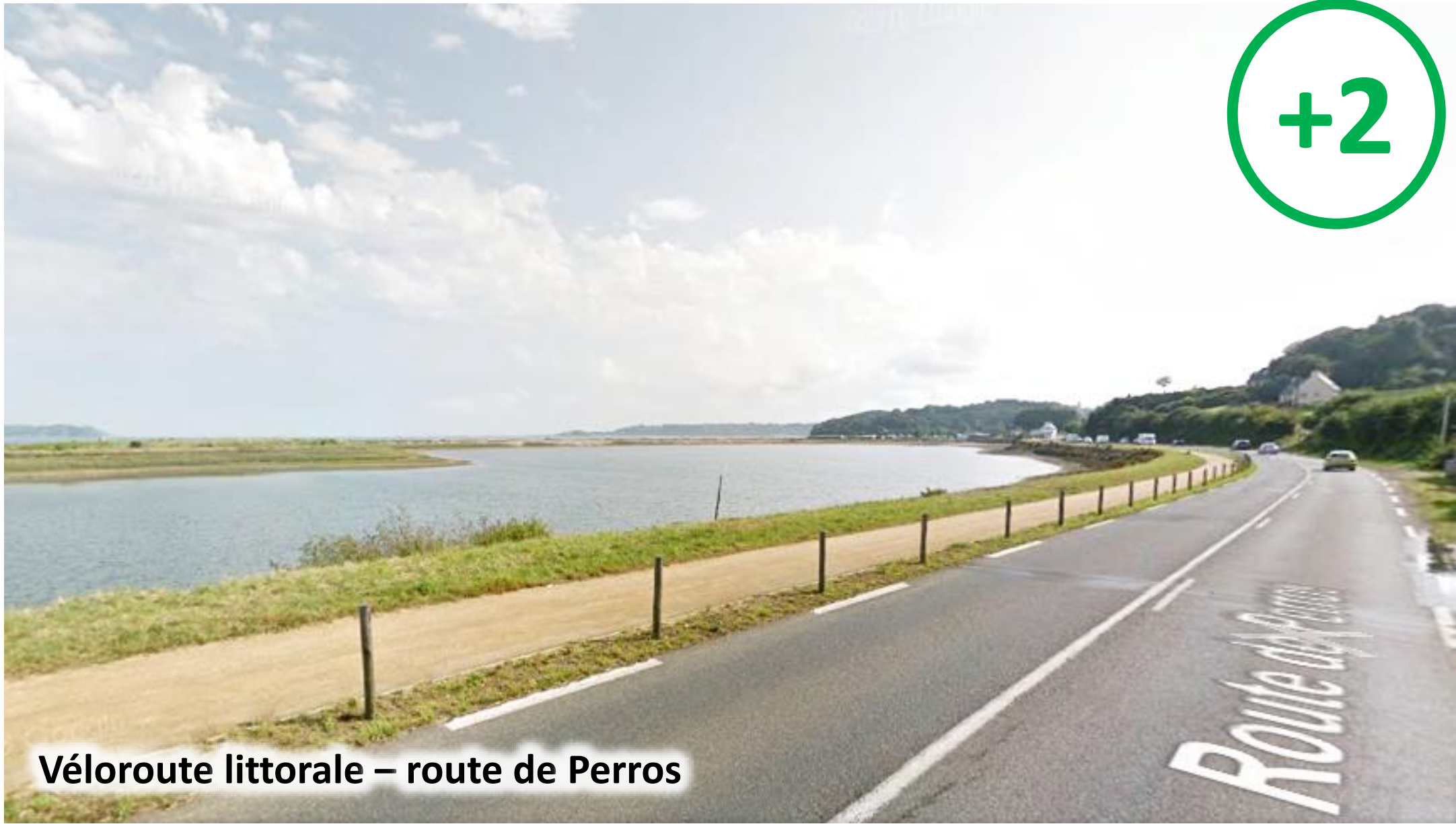
Véloroute littorale – route de Perros