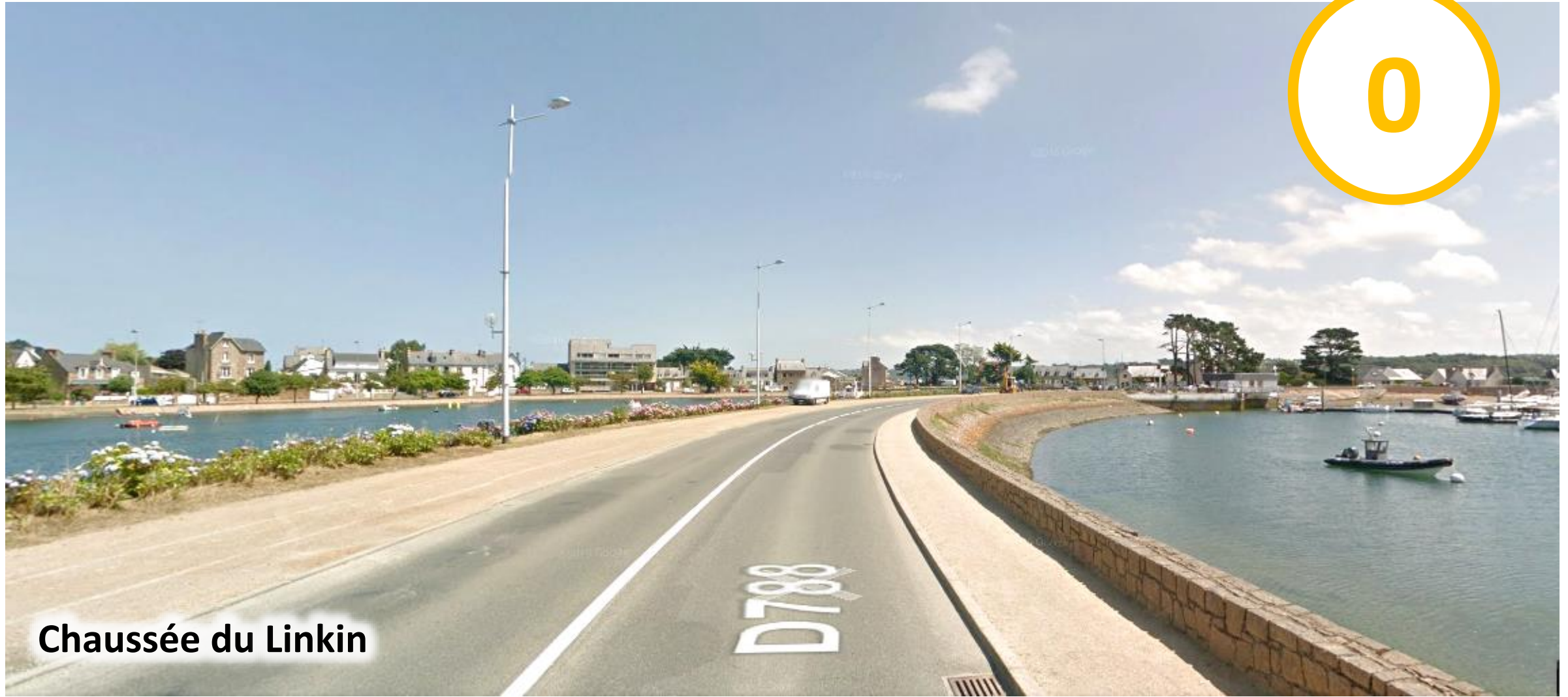
Chaussée du Linkin