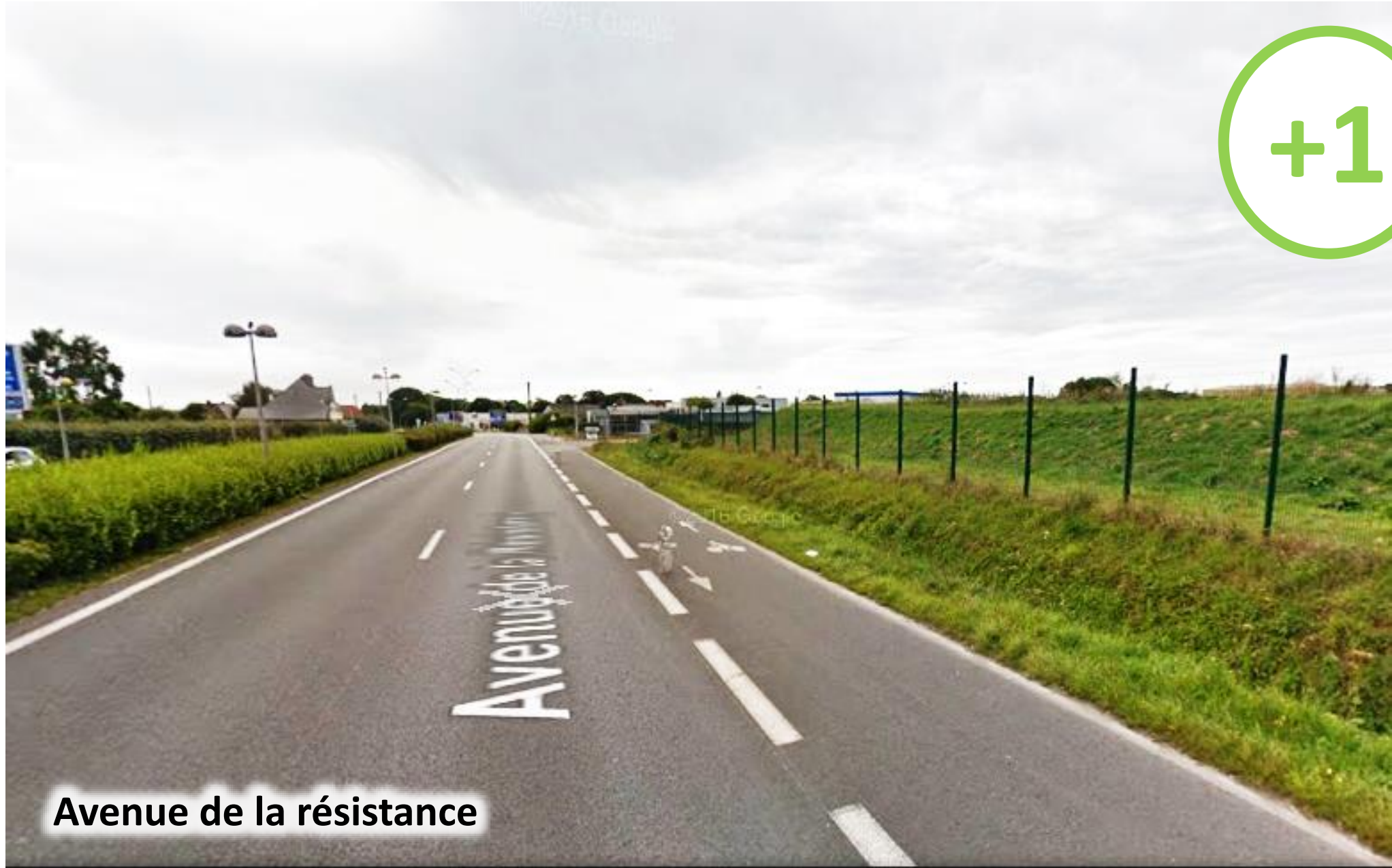
Avenue de la résistance