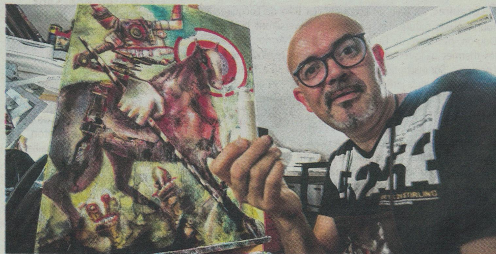
Doudoudidon à la chapelle de Christ, Ploumilliau Fred Legrand

Le troisième arrêt expo se situe à Ploumilliau. Si les cy-