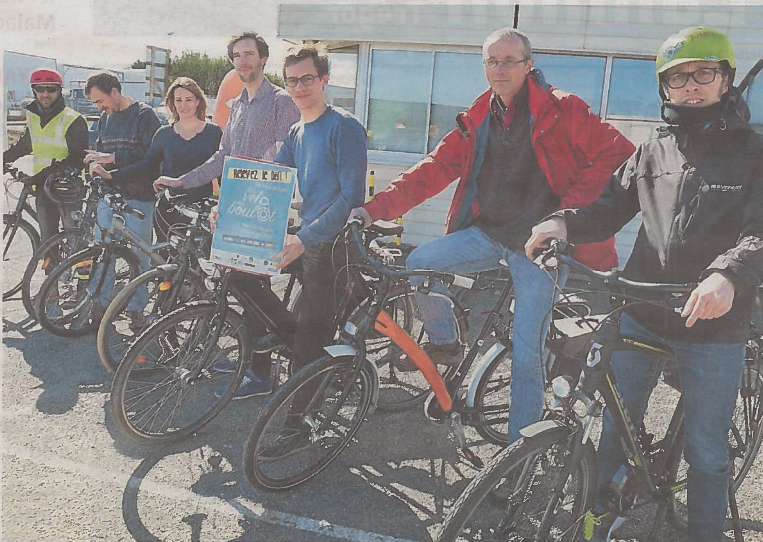
Les responsables de l'association Trégor bicyclette ont présenté son défi vélo interentreprises dans les locaux de la société Eco-Compteur.

Prendre son vélo pour se rendre au boulot en mai ! C'est le défi proposé aux salariés de l'agglomération de Lannion. C'est bon pour la santé et l'environnement. Pour les inciter à pédaler, l'association Trégor bicyclette va organiser un défi vélo interentreprises.