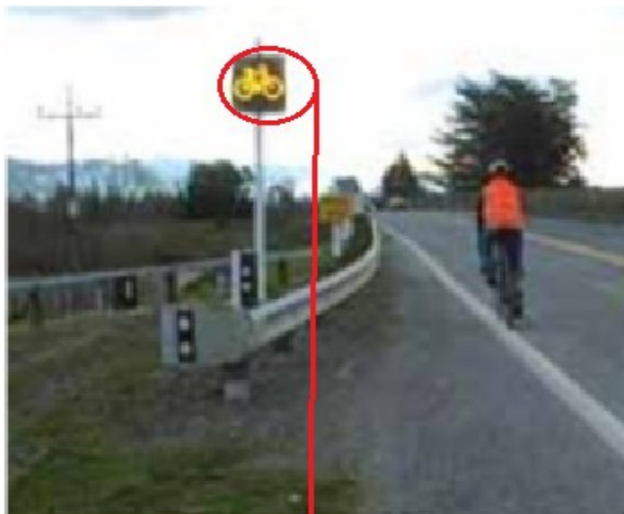
Déclenchement au passage du cycliste

Certains lieux incontournables sont difficiles à sécuriser pour les vélos. Mettre un panneau «attention vélos», même gros et bien visible, n'a qu'un impact limité car 9 fois sur 10 quand un automobiliste passe, il n'y a pas de vélo. Un peu comme pour les panneaux «attention verglas» qui restent en place à longueur d'année. La société Eco-Compteur http://www.eco-compteur.com/ de Lannion a développé et mis en place une solution très intéressante : un capteur détecte le passage d'un vélo et déclenche l'allumage d'un panneau lumineux signalant le cycliste pendant la durée nécessaire au franchissement du passage dangereux. Le coût d'un tel système est de l'ordre de 6000€, ce qui est ridicule par rapport au coût d'un aménagement ... ou au coût d'un accident.